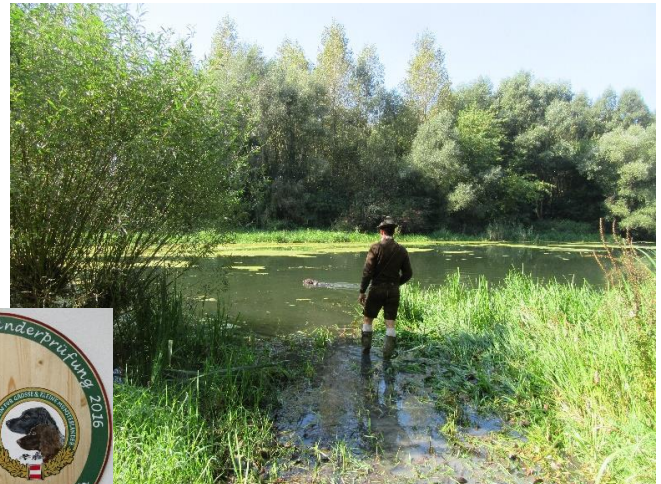
Epreuve du cherche perdu à l'eau