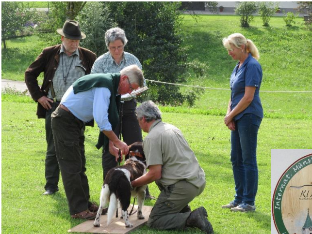
3 juges officient dans le ring