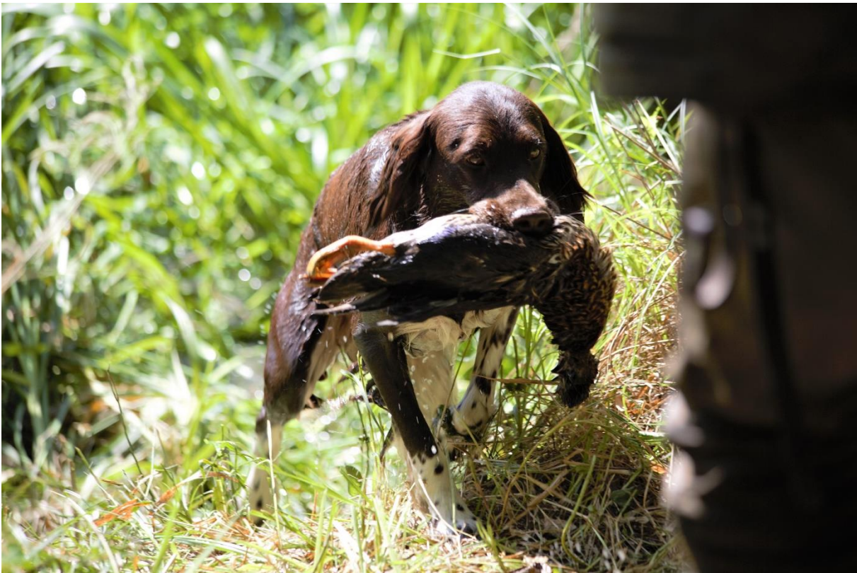
Travail à l'eau – Rapport du canard