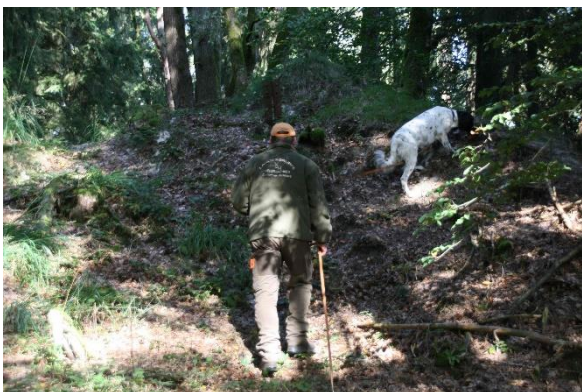
Départ de la piste de sang

qualités et faire preuve de leurs aptitudes de chiens de chasse pratique polyvalents sur des terrains parfaitement adaptés à ce type d'épreuve au bois, à l'eau et très giboyeux en plaine.