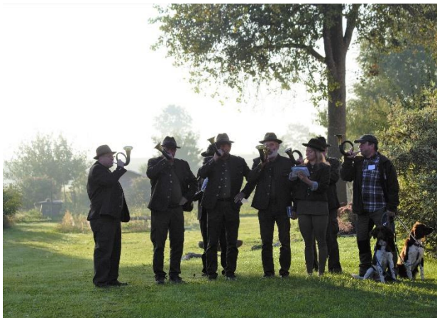
Accueil des participants par les cornistes