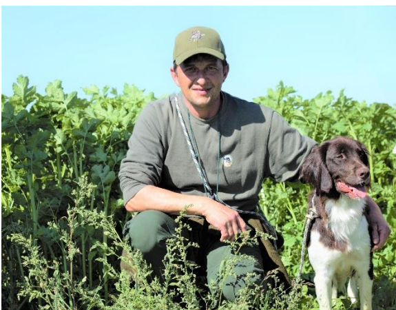
Meilleure chienne de l'exposition